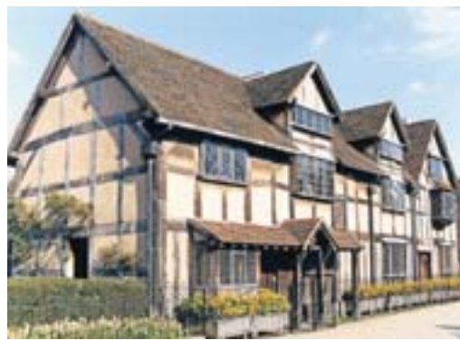
Oben: Shakespeares Geburtshaus ist seit mehr als 100 Jahren Treffpunkt für seine Verehrer.