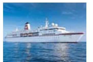
Die MS „Deutschland“