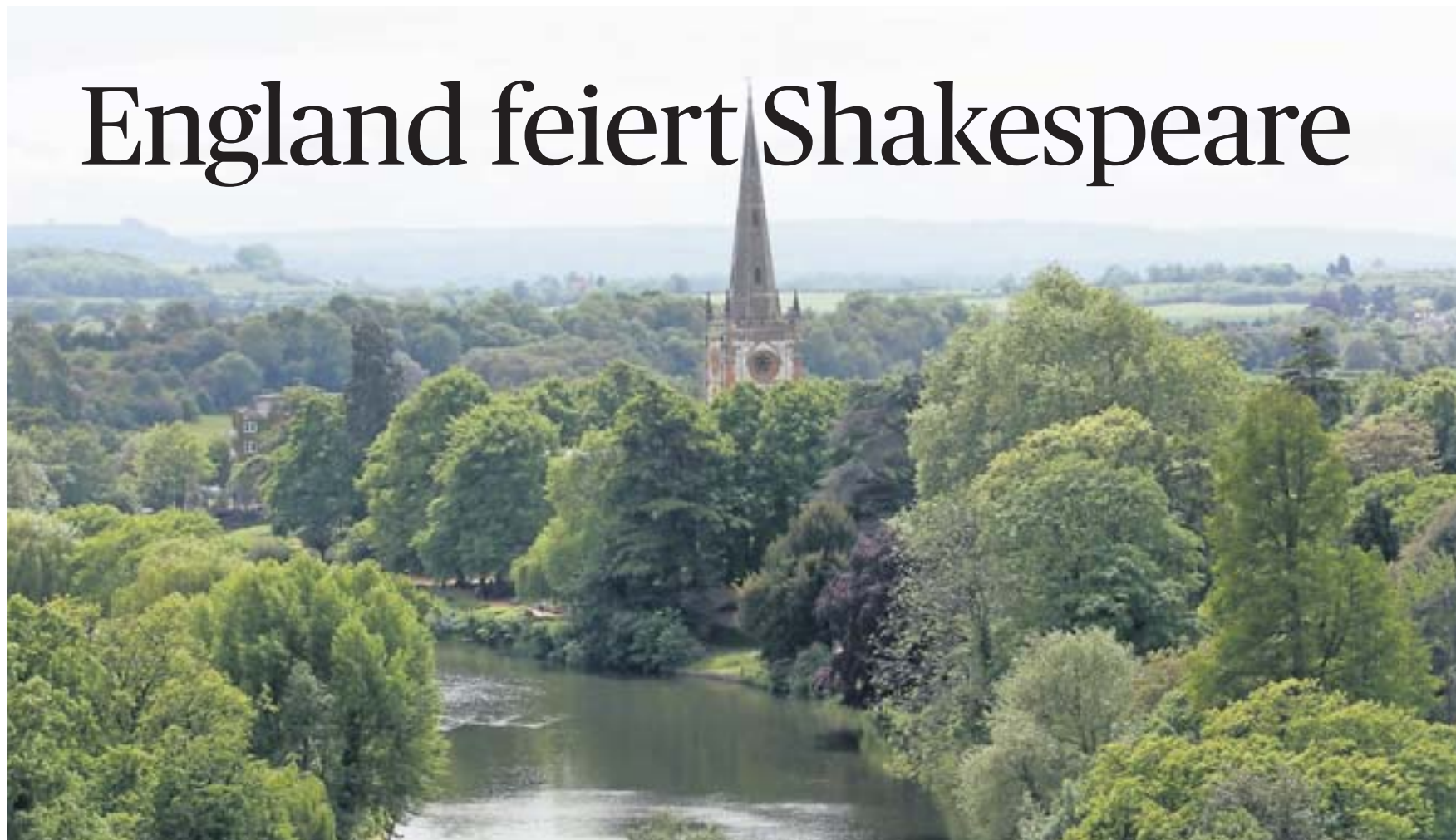
Hier fand Shakespeares Taufe statt: In der Holy Trinity Church in Stratford-upon-Avon ist sie für den 26. April 1564 vermerkt.